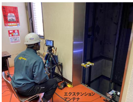
左側 アンテナ使用イメージ 右側 アンテナ使用例