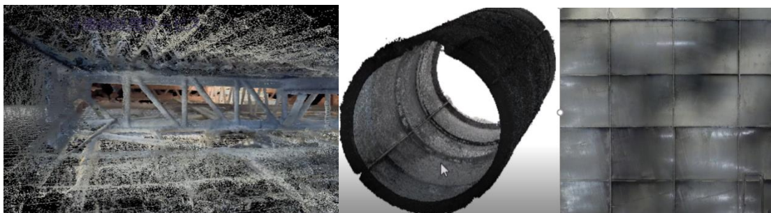
写真左側が屋根裏部の点群データ 写真中央側、煙突内部の 3D モデル 右側煙突内部のオルソ画像(展開画像)

この度、「IBIS 導入プラン」に、画像処理し放題サービスを追加し、IBIS で撮影した点検動画を 3D モデル、点群データ、オルソモザイク画像に変換するサービスを開始しました。これにより小型ドローン IBIS で撮影した点検データは、動画加工用の高性能サーバや専用ソフトウェア、画像処理エンジニア不要で、クラウドサービス上からの申請で容易に画像処理を実施できます。